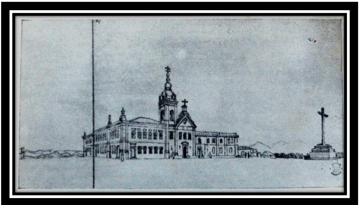
Fazenda Real de Santa Cruz

Desenho de Maria Graham, Museu Britânico, foto IPHAN