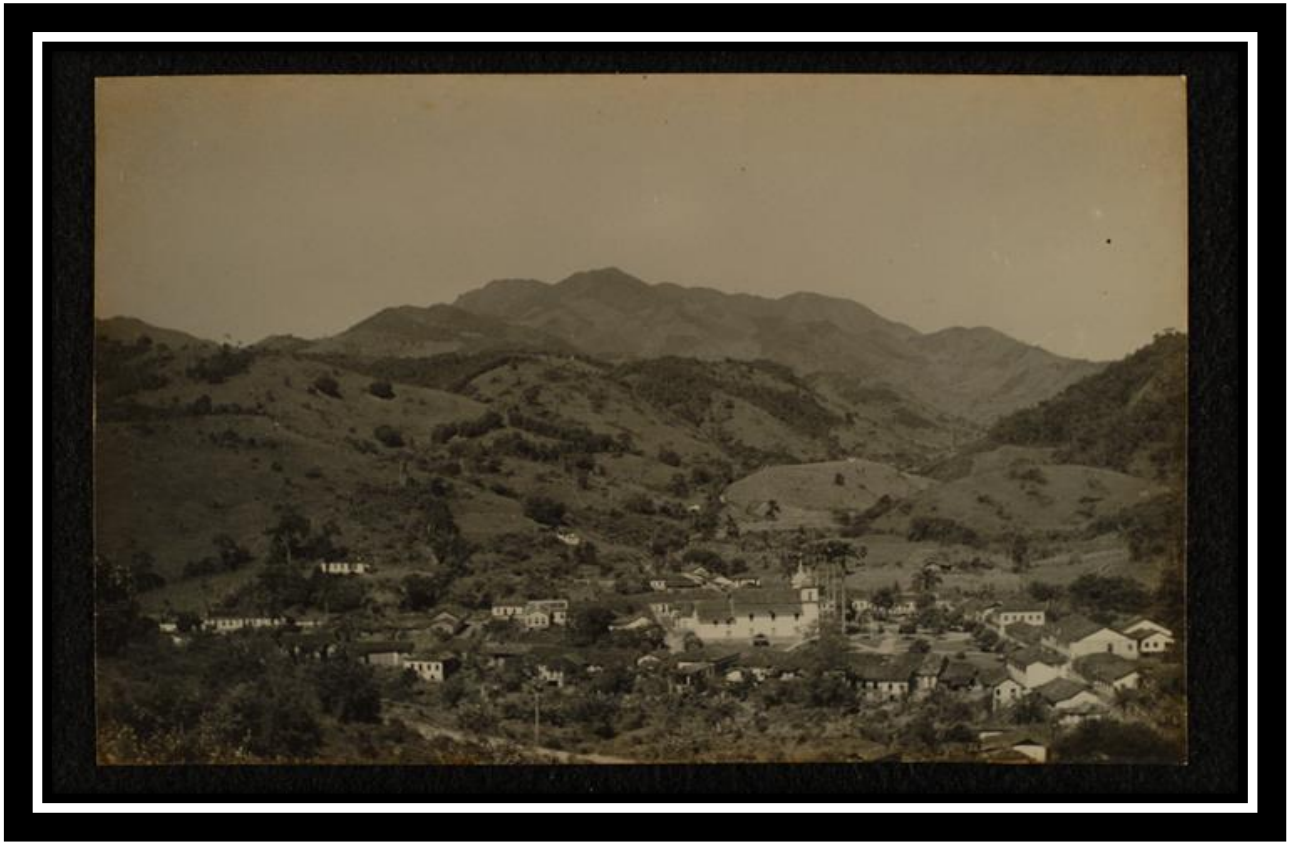
São João Marcos