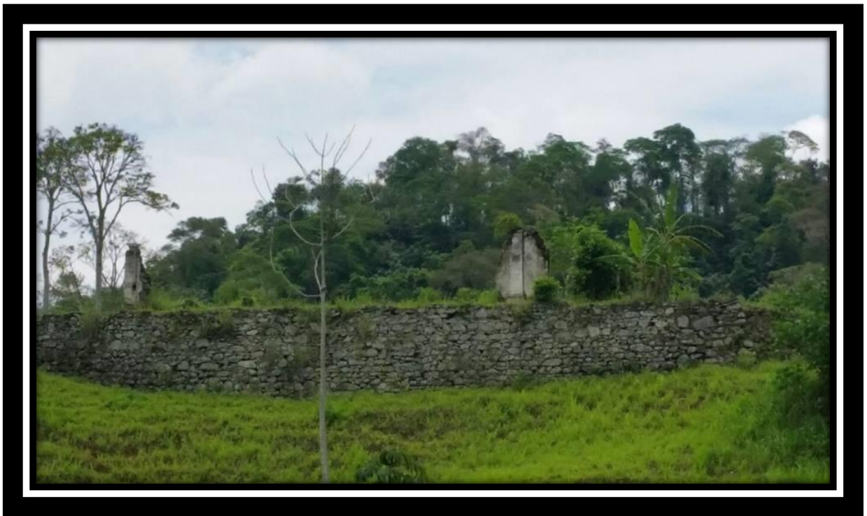
Ruínas da Imperial Feitoria de Santarém – Serra do Matoso, Piráí – RJ