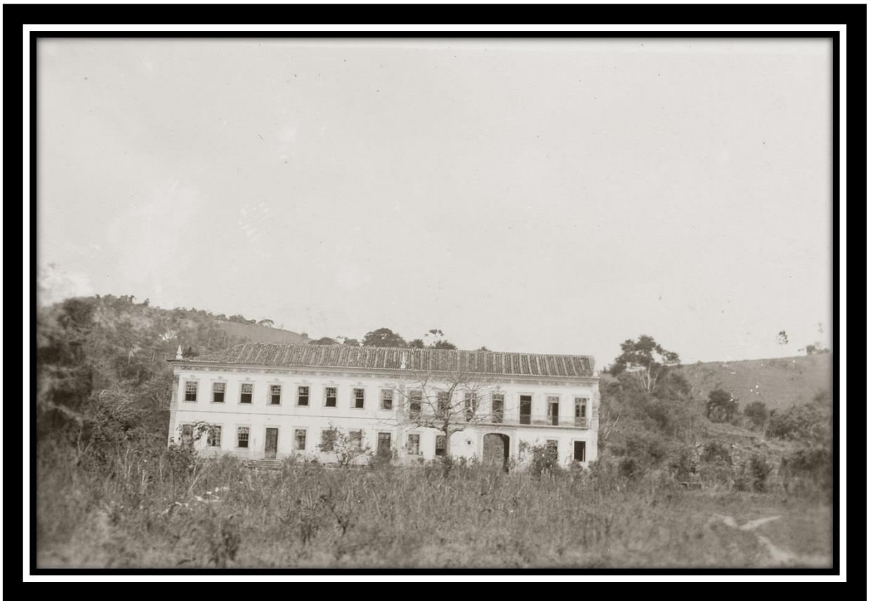
Fazenda da Olaria