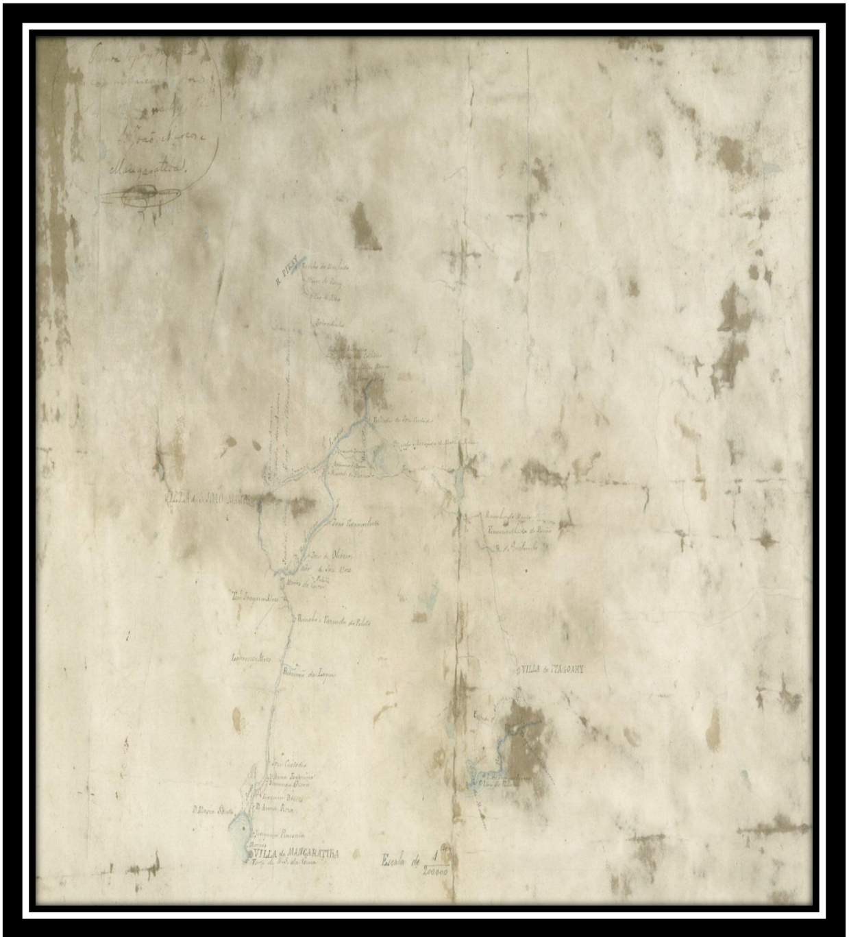
Planta Topographica de Comunicação das Vilas de Itaguahy, Pirahy, São João Marcos e Mangaratiba.

s/d – Arquivo Nacional do Rio de Janeiro – Autor desconhecido.